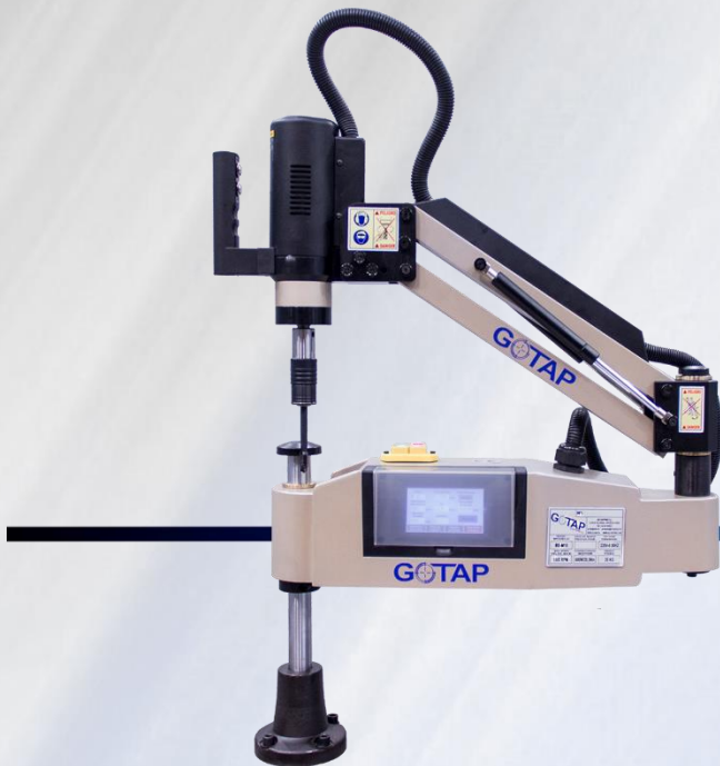
MOD. REV M10