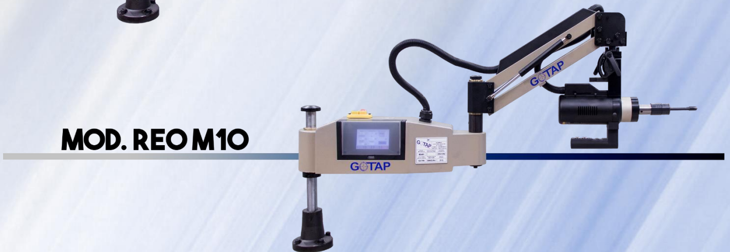
MOD. REO M10