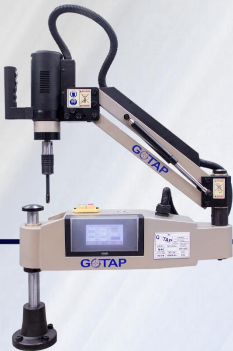
MOD. REV M12