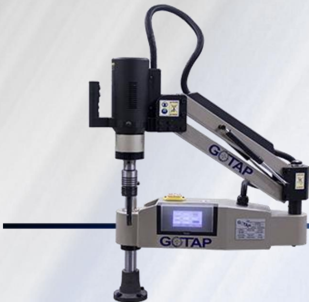
MOD. REV M20