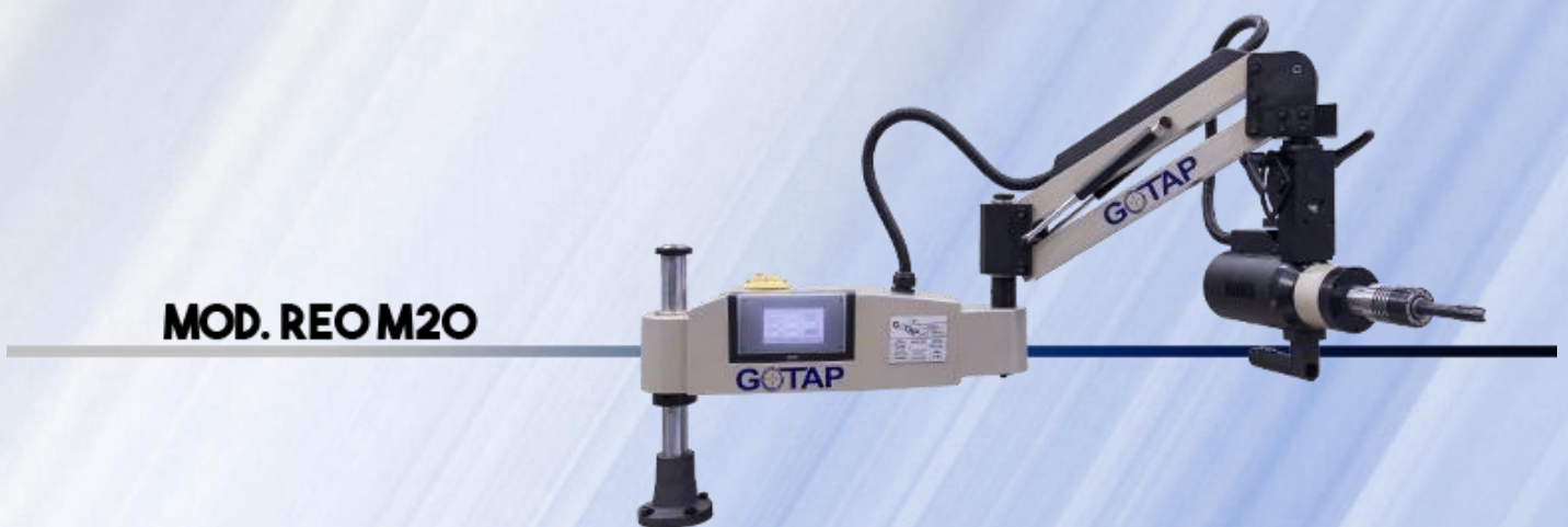
MOD. REO M20