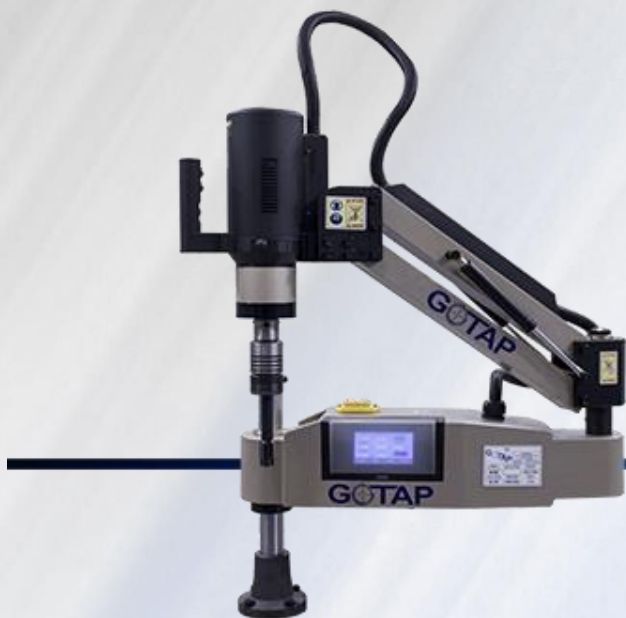
MOD. REV M27