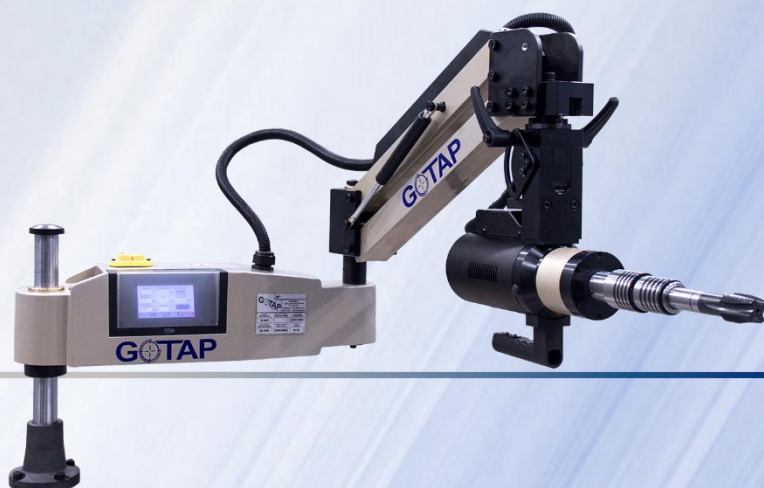
MOD. REO M33