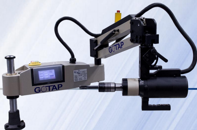
MOD. REO M27